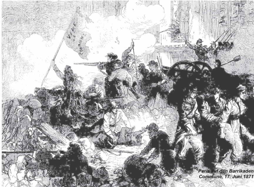
Paris auf den Barrikaden Commune, 17. Juni 1871

Der Donner der Pariser Kanonen hat das Proletariat aus seinem Zaudern geweckt. Die nachkommenden Generationen des Proletariats in Russland waren nicht nur die Schüler der